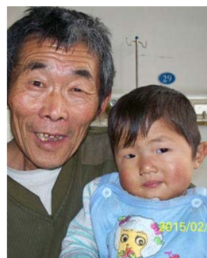
术后五天与爷爷合照