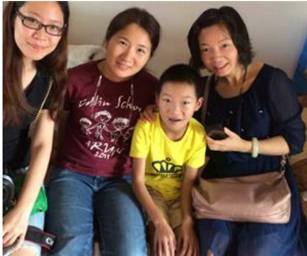
2014 年 8 月，上海志愿者和回国探亲的美国志愿者一起去看望一个即将做手术的心脏病孩子

除了曼大夫之外，我们还要感谢国内外许多帮助先天性心脏病孩子的志愿者们。为了挽救孩子的生命，他们/她们四处筹款，为费用不够担忧，为孩子的病情焦虑，有时还要承受生离死别的痛楚..... 没有这些志愿者的辛苦付出，很多孩子的生命也不会得以延续。