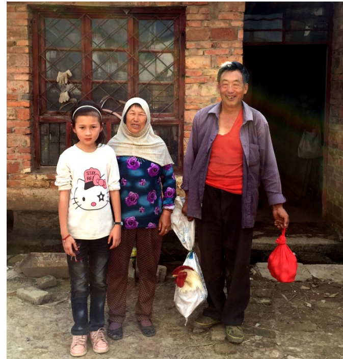
临走，朴实的爷爷奶奶拎了一大堆东西送给我们表示感谢