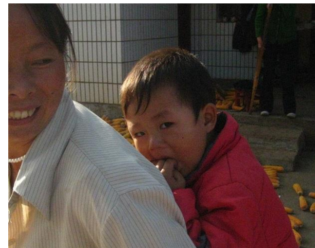
幸福的妈妈，健康的小正能