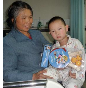
快出院了，奶奶很高兴